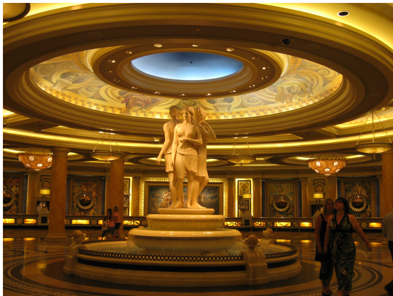
Das ist die Eingangshalle zum Einchecken.

Für die erste Erkundung entschlossen wir uns für leichtes Gepäck also nur wenige Fotos, doch morgen machen wir dann mehr.